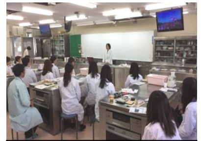
以前の講習会風景