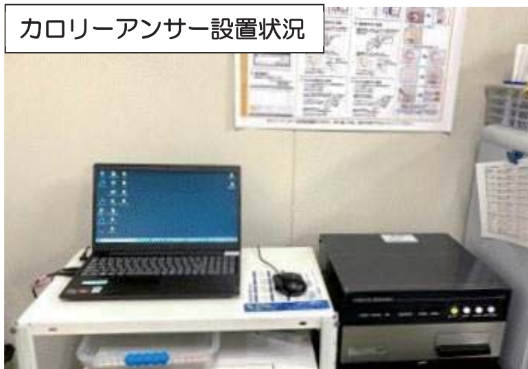
カロリーアンサー設置状況

現在、前機種の CA-HN をお使いのユーザー様で CA-HM への買替えをご検討でしたら、販売代理店又は、下記弊社連絡先までご連絡頂きます様、宜しくお願い致します。