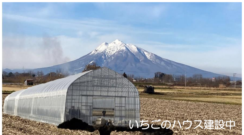
いちごのハウス建設中

9月ににんにくを植付し、現在はいちごのハウスを建設中で、年明けから栽培を開始します。地元の平川市でも農家の高齢化が進んでいて、耕作放棄地が増えていますので、少しでも地域貢献するため、これから農業生産事業を拡大していく計画です。いちごの生産には弊社で開発したスマート農業機器も使用し、展示場としても活用する計画です。青森へお越しの折には是非お立ち寄りください。