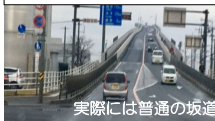
実際には普通の坂道

CMで有名になった道を訪れてみました、チョット残念な感じの「ベタ踏み坂」写真の撮り方でこんなに違う？