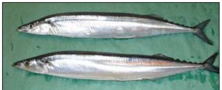
上：ふつうのさんま

ここで最近やってみた面白い実験をご紹介します。「かつお」の春獲りと秋獲りでは100g当たりのカロリーが40%以上違う事は周知のことです。食べても戻り鰹のねっとり感は誰でも実感できます。ではでは、サンマの開き(干し)は分かりますか？まず、モデルのようにスマートなサンマとグラマーなサンマを比べると驚きの事実が！可食部100gを比較するので、頭と中骨を取り除き、重量を測定すると何とどちらも18g平均なのです。しかし可食部はスマートサンマが88gに対してグラマラスサンマは145gもあります。カロリーを実測すると片や280kcalに対し450kcalも有るのです。こういう面白い真実や成分表に頼るだけでは不都合な真実が手に取るように分かるのが「カロリーアンサー」のメリットでもありますね。今月から来月にかけて契約納品のほか緊急的な契約も多く製販ともに臨戦態勢が続きます。