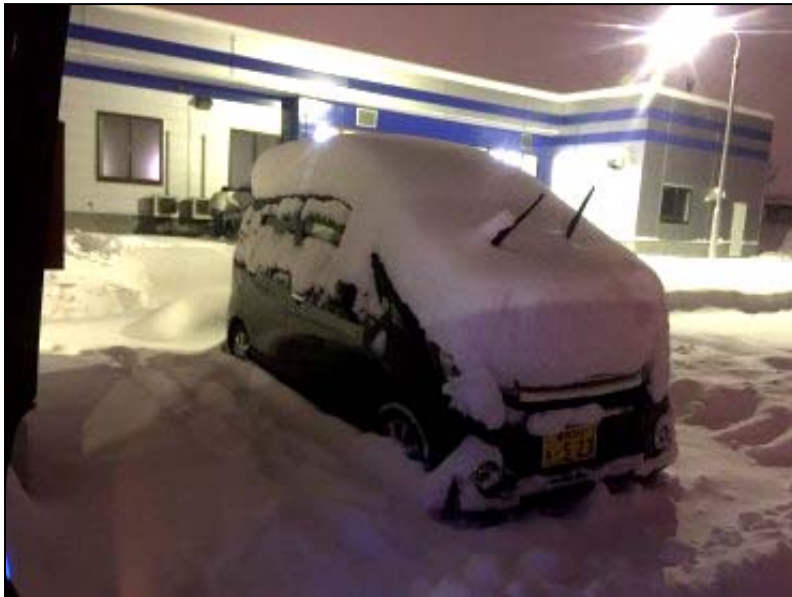
とある日の大雪、1時間程で積もる

新年が明けたと思ったらもう2月です。早咲桜が話題になる一方で郷里では例年通りの雪です。1月号で述べた通り暮れからお正月三が日は穏やかで雪かきの「ゆ」の字も出ないくらい楽をさせて貰いましたが家族がそれぞれの住処に戻り、私も東京へ。その途端に青森は大雪。玄関に大きな雪だるまがあって隣に寒い顔をした孫が立っている写真が送られてきて電話はかけられません。(雪かきに來いと気合を入れられますから)東京というか雪の無い地域は本当に楽です。毎度の事ですが、TVで「今朝も東京は本当に寒いですね～」と話題にしていますが、私自身では東京