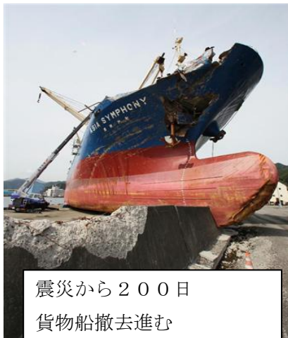
震災から200日 貨物船撤去進む