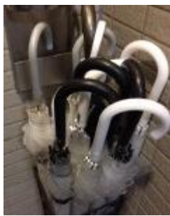
柄の黒いのは私の傘間違わない様に同じ物を購入する。

皆さま、こんにちは。いかがお過ごしでしょうか。東京は例年に比べると雨が少ないような気がしています。いつもの年ならば傘は手放せずゲリラ豪雨に遭遇したくないものだから天気予報は見逃せないのですが…まあ、津軽では暖冬と言われて少ない雪を喜んでいるものの、一冬を越すと例年通りの降雪量であったという事がよくありますので油断は禁物ですね（折り畳み傘は必携です、