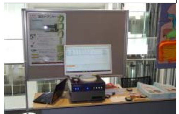
カロリーアンサーCA-HM展示実測風景

今月は出荷関係でまだ、メンテナンスとぶらりラ～メン旅はこれからです。来月をご期待下さい。