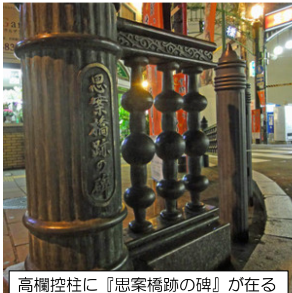
高欄控柱に『思案橋跡の碑』が在る

みなさん、こんにちは（今更ですが「こんにちわ」と、どちらが正しいのか調べてみたら「今日のご機嫌いかがでしょうか」が語源らしいようです）日本語って漢字に平かなやカタカナが混じり、さらに訓読みがあるので想像も妄想も膨らみ易いのかなって思います。言葉遊びのような語彙に先人の粋や絵空事を感じます。昔、石原慎太郎が芭蕉の「古池や…」を高浜虚子が論評した実情風景とは真逆の解釈を披露し日本人の情感なるものを覚醒させました。粋と言えば、長崎を題材にした