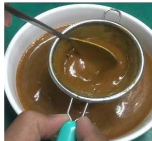
肉を磨り潰しジャガイモと裏漉しをしてペースト状に