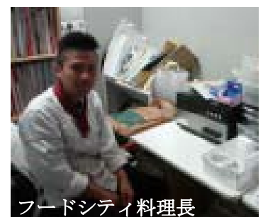
フードシティ料理長

10月も納品2件ありまして、(株)フードシティ様と某研究所です。毎月納品があり、嬉しい限りですし問合せも増えて来てやっと栄養表示に関心が向いてきた感じです。嬉しい話で先日、公益社団法人発明協会にて平成27年度東北地方発明表彰「文部科学大臣発明奨励賞」を受賞、経済産業省にて第6回ものづくり日本大賞 製造・生産プロセス部門「東北経済産業局長賞」を受賞する事が出来ました。ヤッター！！これも食品の栄養表示義務化により測定方法について注目が高まっています。