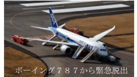
ボーイング787から緊急脱出

いい年ついではありませんが皆さんにも私のラッキーさを教えまね！ まず、飛行機の窓から富士山がくっきり見えた日は11日でした。羽田から高松へのフライトで何とANAのボーイング787でした。とても安定したフライトで「富士山がくっきりとみえますよ」という案内に乘客から少し歓声が上がったくらいでした。それが翌日以降のトラブルで今日からは運航停止だとは。緊急着陸だなんて、覚悟しちゃいますよね！次は15日の夜、9時30分頃の出来事です。朝のニュースで山手線の運行50周年を記念して1編成だけ当時の車体カ