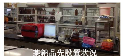
某納品先設置状況