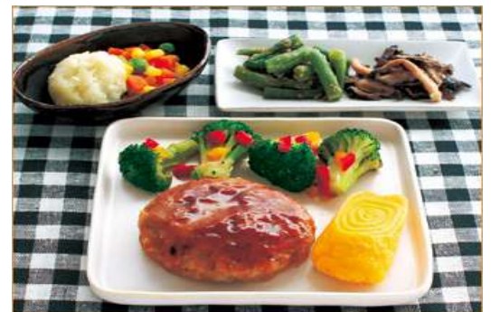
【ニチレイフーズ・冷凍食品】カロリー280kcal 気くばり御膳 照り焼きハンバーグセット

ヨシケイなどに代表される宅配食材（自宅で調理）に加えここ数年、大手の冷凍ディッシュへの参入が増えています。惣菜の市場は、年間8兆1,226億円といわれていますが、スーパーマーケットが重点的なカテゴリとしているその市場が、「通販サイト」に侵食されつつあります。ちなみに、スーパーマーケットの重点カテゴリとして、①総菜、②農産、③水産があります。それぞれ客単価アップと粗利益向上という大きな課題を抱えており、商品力アップや販促力アップの為に、各社が様々な施策を実施し差別化を図っています。すかいらーく、ニチレイ、パル、oisix、大地を守る会、ヨシケイ、らでいっしゅぼーやなど、各社、スーパーが陳列して販売している方法と異なるアピールを行っています。ユーザーからの評価はそれぞれ差がありますが、oisixなどの場合は以下の通り。