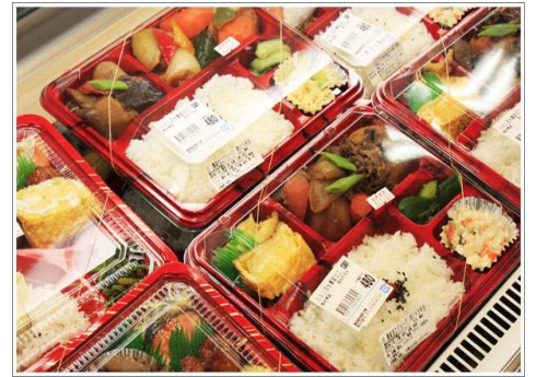
▲安さとボリュームが売りのスーパーのお弁当

最近のスーパーの惣菜売場は「マンネリ化」とでもいうのでしょうか、一度買ったもういいか～というようなお弁当や惣菜ばかりが並んでいます。景気の悪化にともない、中食傾向にあった消費者に向けて、低価格でボリュームを売りにした商品が定番化してしまいました。その後、消費者も節約することに飽きてしまい、今日に至っては、少し高くても良い物を、美味しくヘルシーな物、栄養バランスのとれた食事を心がけたいという人が圧倒的に増えました。しかし、まだまだスーパーの惣菜コーナーは、そういったお客様ニーズにどう応えればいいのか模索している店舗がたくさんあります。これからは、消費者の健康を重視したコンセプト商品が「売れる」鍵となるでしょう。そういった意味では「通販サイト」のアイデア商品が今後の惣菜市場を盛り上げることになるのでは。