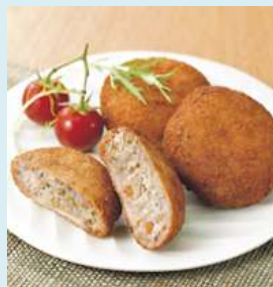
肉の代わりに蓮根使用 蓮根カツ

らでいっしゅぼーやの「食べもの」や「生活用品」は、人の体のことも、環境のことも考えたものばかり。お客様に喜んでほしいという思いと、全国2,700軒の生産者やメーカーとの信頼関係で約7,000品目もの安心でおいしい商品が生まれています。とくに、アレルギー対応食品に関しては、アレルギーでお悩みの方などのニーズを優先し、原材料などのアレルゲンマーク表示を義務としています。