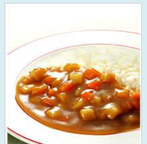
アレルギー対応食品 ヤサイカレー

通販サイトのアイデア商品は、忙しい私達の健康管理に役立つアイテムとして浸透しております。普段の生活に欠かせない栄養バランスをきちんと考えた商品ばかりなので「安心」してご利用いただけます。