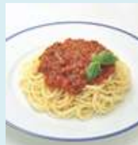
国産の野菜と果物で仕上げたミートソース